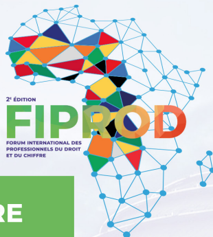
Image et relations publiques